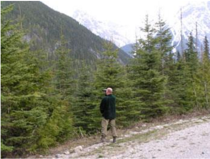
Min kæreste afsøger bjergside med kikkert