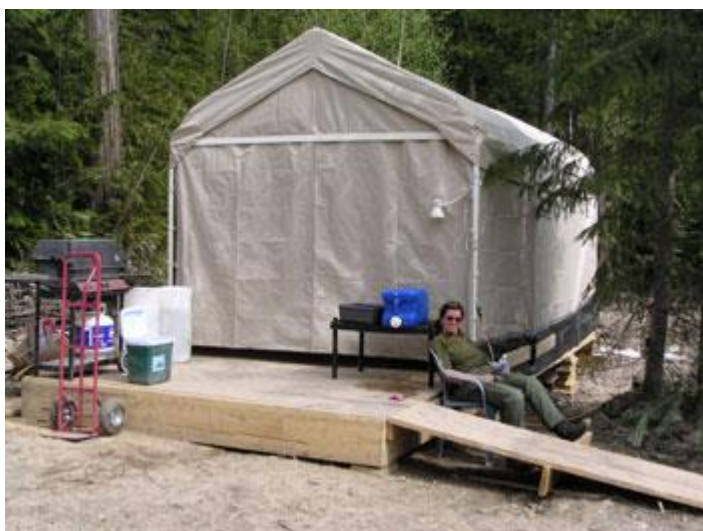
Billede af køkken/spise teltet.

Der var således ikke tale om overflod af moderne faciliteter, men omvendt manglede vi heller aldrig noget under vores ophold