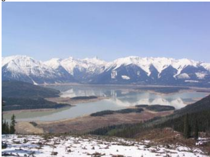
Udsigt over en lille del af Kinbasket Lake

Og så blev det endelig den 14. maj... Den første af tre flyvninger gik til Kastrup, - derefter videre til London, og endelig efter 17 timers rejse stod vi i Lufthavnen i Calgary. Nakkehårene begyndte imidlertid at rejse sig, da våbenkufferten dukkede op på transportbåndet. Hvordan det end var lykkedes for bagagepersonalet er stadig en gåde, men den ene ende af kufferten var smadret, og løbet fra den ene riffel stak ud. Hvorvidt riflerne havde taget skade, var umuligt at afgøre på stedet, men der blev naturligvis optaget den fornødne skadesrapport til eventuel senere brug. Herefter afhentede vi den bestilte udlejningsbil (igen fantastisk hvad internettet kan udrette), og derefter blev kursen ellers sat vestover imod bjergene. Området hvor vi skulle jage, ligger midt i de Canadiske Rocky Mountains. Jagtreviret er på ca. 9.000 kvadratkilometer – unægtelig andre størrelser, end hvad vi er vant til i det Midtjyske. En stor del af området grænser op til Kinbasket Lake, som er en kæmpestor opdæmmed sø. Alene på langs er der 140 kilometer fra den ene ende til den anden. Reviret ligger desuden ”klemt” inde imellem 7 store Nationalparker, heriblandt de berømte Jasper og Banff. Der foregår ingen jagt i Nationalparkerne, hvilket betyder at der konstant indvandrer bjørne herfra til vores jagtområde. Den nærmeste by hedder Golden, og afstanden herfra og til Jagtlejren er godt 50 kilometer.