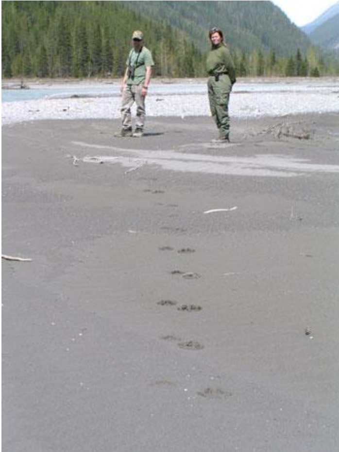
Friske fodspor fra Ulv – større end man umiddelbart forestiller sig.

Nu hvor vi allerede på jagtens første dag havde opbrugt halvdelen af vores licenser, var det tid til at definere mål og succeskriterier for resten af turen. Vi var begge enige om, at den næste bjørn så vidt muligt skulle være større end den første.