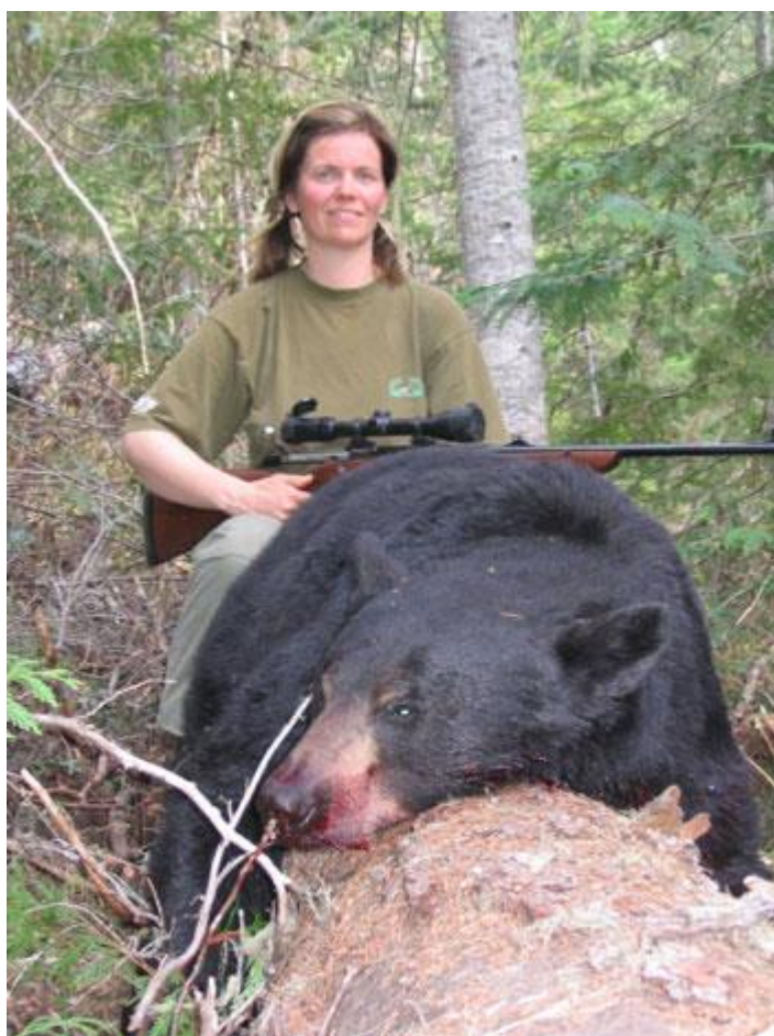
Min bjørn nummer to..