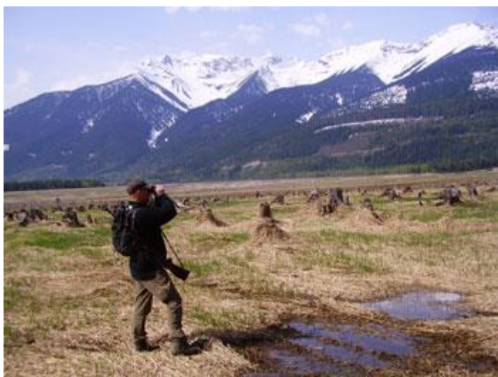
Strandeng med masser af friske grønne urter.

Vi havde valgt at starte dagen langt oppe på en bjergside – en lille rydning der gik under navnet "Udkigsposten". Heroppefra kunne vi overskue størsteparten af øerne, samt tilhørende strandenge. Det var en dag med godt vejr, og vi gjorde os det behageligt sådan at vi kunne udholde ventetiden.