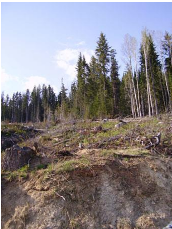
Billede taget fra skudstedet op imod træstubben, hvor bjørnen stod placeret.

Afstanden fra vores nuværende position og op til Bjørnene, var mindst et par kilometer. Terrænet var dog tilstrækkeligt åbent til, at vi hele vejen opover kunne se konturerne af en gammel vej. Formodentlig en vej der var lavet i forbindelse med rydning af området.